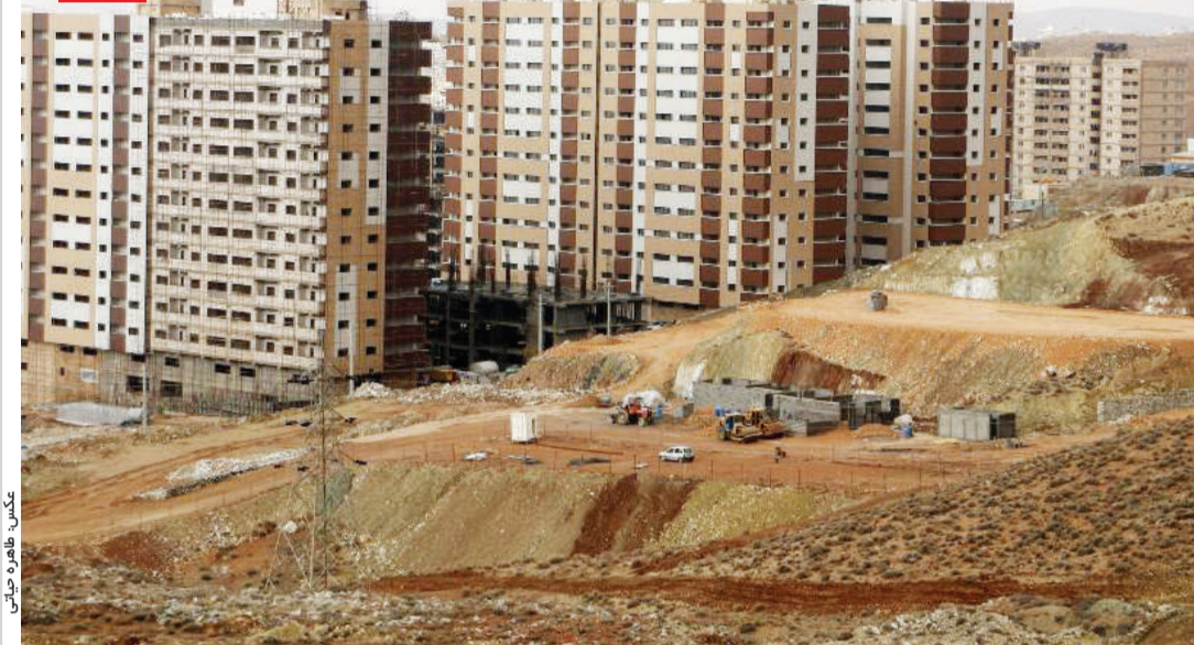
مسکن ها در شیراز